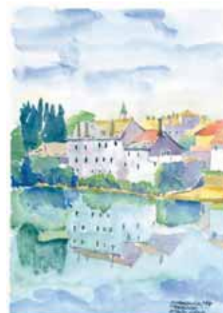
Trebinje - Stari grad