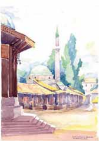
Bašaršija - pogled od Sebilje prema bašaršijskoj džamiji