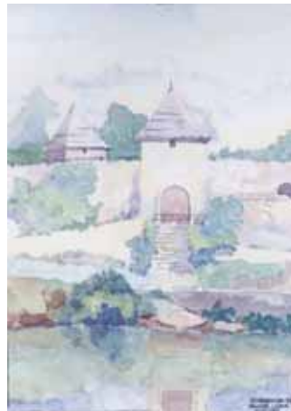
Banja Luka - Tvrđava Kastel