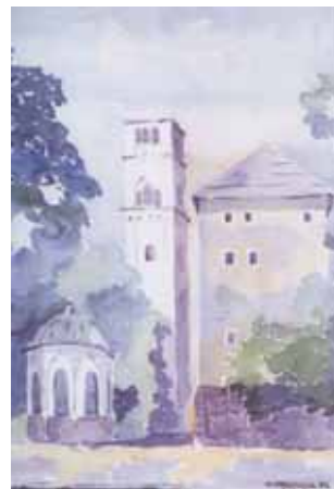
Bihać - Turbe, Kapetanova kula i crkva Svetog Antuna