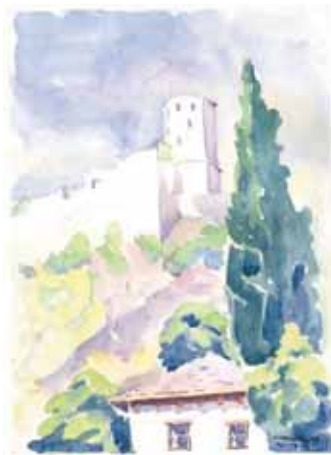
Počitelj - Pogled na utvrdu