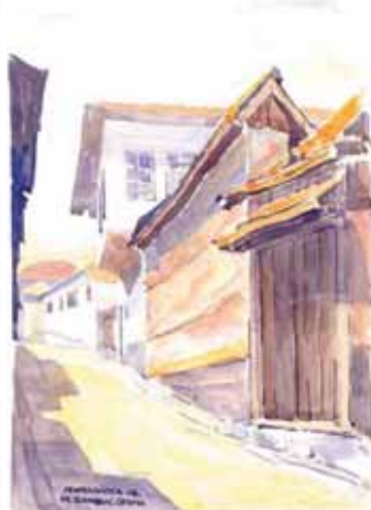
Ulica Sumbul - česma