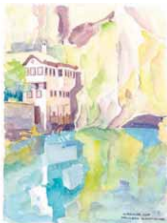
Vrelo Bune - Blagaj - Tekija