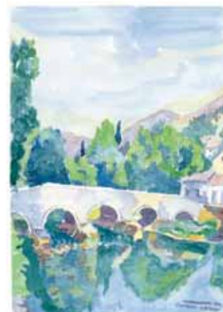
Čuprija u Stocu