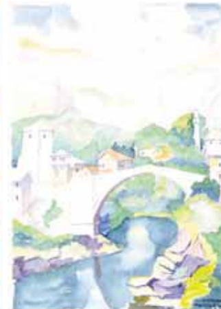
Mostar - Stari most