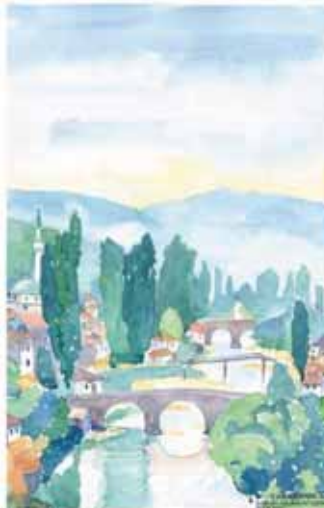
Stari sarajevski mostovi