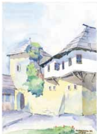
Jajce - Omer-Begova kuća